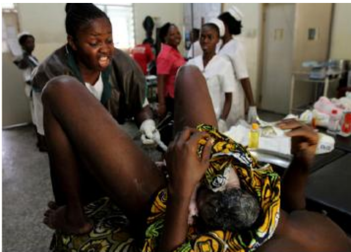
El trabajo de la fundación MacArthur en la salud reproductiva y de la población se enfoca en la tasa de mortalidad maternal en India y Nigeria.

NECESITAMOS SER RESPONSABLES, TENER CLAROS NUESTROS OBJETIVOS Y MÉTODOS Y ASEGURARNOS DE QUE TODO LO QUE HAGAMOS ESTÉ ABIERTO A UNA EVALUACIÓN INDEPENDIENTE.