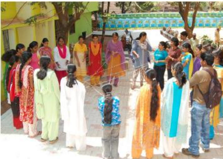
Sangath está comprometido a mejorar la salud a lo largo del ciclo de vida. Sus principales áreas de enfoque son el desarrollo de niños, salud de adolescentes y jóvenes, y salud mental en Goa, India.

Un ejemplo reciente: durante más de una década, la Fundación ha trabajado para conservar la vivienda de renta asequible en los Estados Unidos. La mayoría de estas viviendas son privadas, y administradas por propietarios que dependen de una red de subsidios y acuerdos especiales de financiamiento. Nuestro primer instinto fue que al reducir los costos de energía eléctrica en estas propiedades se beneficiaría a los dueños, que trabajan con un margen de ganancia ajustado por lo que es menos probable que vendan o remodelen las propiedades para volverlas más eficientes en el consumo de energía.