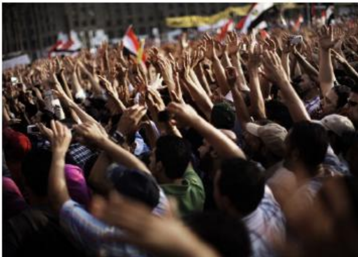
Protesta anti-Mubarak en Egipto. Participantes levantan las manos durante una manifestación en la Plaza Tahrir en Cairo

Esta confusión representa una falla tanto del análisis como de la imaginación. Al igual que nos sorprendió el fin del comunismo, los cambios en el Medio Oriente se presentan sin un sentido claro de las causas y consecuencias, por lo que es poco probable que nuestra respuesta sea creativa o efectiva. En resumen, el análisis de inteligencia falló en un área vital para la paz y la seguridad internacional.