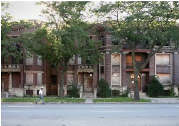
MacArthur apoya el Programa de Nuevas Comunidades, un esfuerzo de revitalización completa de la comunidad en 16 vecindarios de Chicago, como parte de su objetivo de aumentar las oportunidades sociales y económicas para la gente de bajos ingresos de Chicago.

Para contestar estas preguntas, los miembros del equipo realizan una revisión exhaustiva de lo que se conoce. Examinan un espectro amplio de evidencia, comisionan estudios y consultan a expertos y actores clave. En muchos casos, lo que aprendemos nos dice que ese asunto no coincide con nuestras fortalezas, o está más allá de nuestras capacidades para poder tener un impacto significativo.