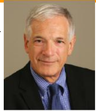
Presidente de la Fundación MacArthur Robert L. Gallucci